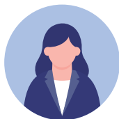
株式会社 調転社 久米村様より

制作部門には元々個人で法人プランの開始前からプレミアムプランに加入している者が複数名おりました。素材の品質やサイトの使い勝手などが分かっていたため、以前より加入人数を増やしたいと考えていましたが、請求が各自バラバラになる事や利用状況や料金の把握に不便を感じており増やすことが出来ていませんでした。法人プランが開始されたことで、それらの問題が解決すると考え 2019年5月から導入しました。